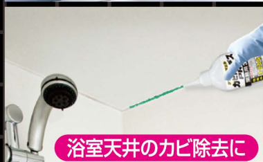
浴室天井のカビ除去に