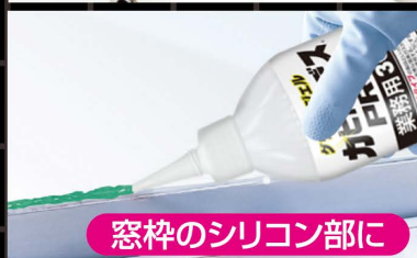
窓枠のシリコン部に